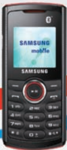
Samsung 2121 Afl 99